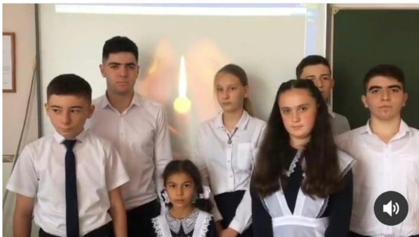
Вахта памяти « Помним Беслан »