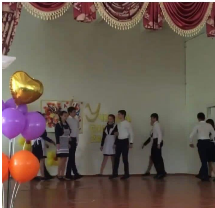
Праздничный концерт к Дню учителя