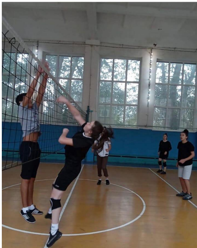
Занятия в школьном спортивном клубе «Вымпел»