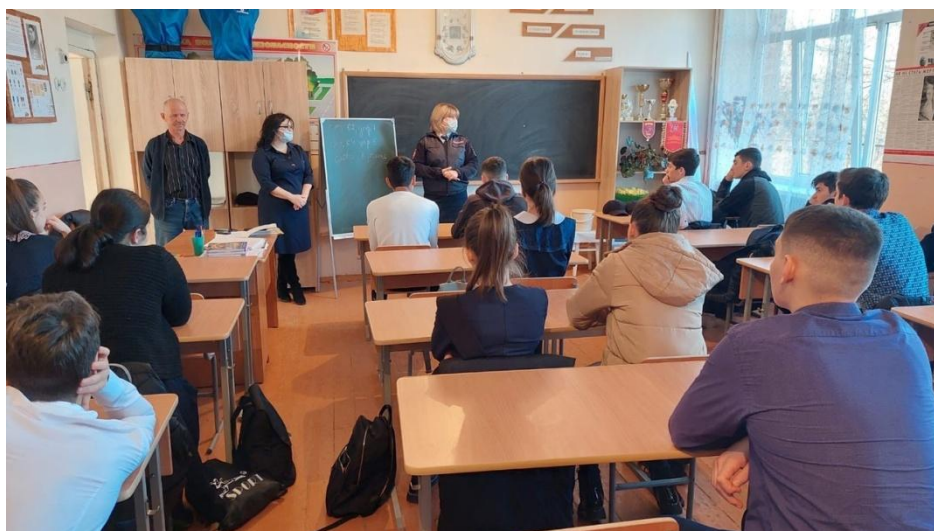
Беседы с инспектором ПДН и сотрудником ЦСМ