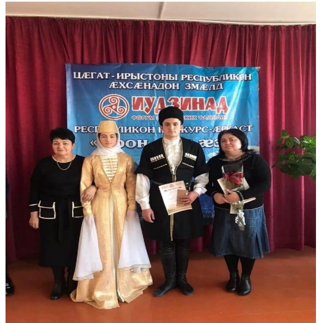
Преподаватели осетинского языка и обучающиеся школы приняли участие конкурсе «Ирон дан аез»(3 место)