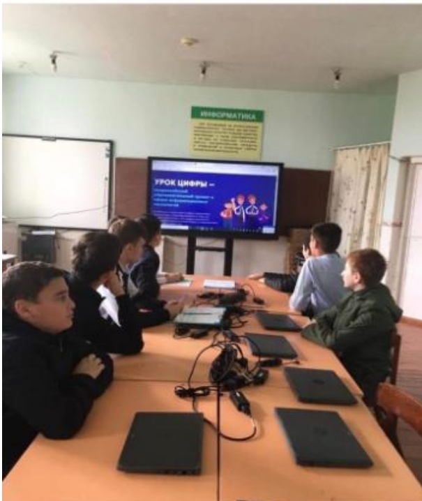
классные руководители проводят Урок Цифры