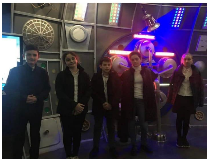
В День Космонавтики посетили планетарий.