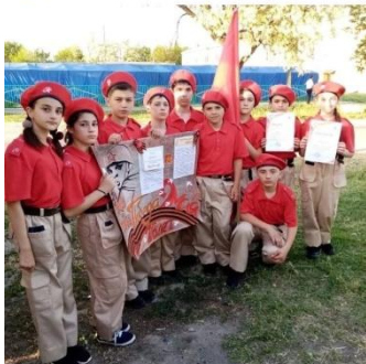
Отряд Юнармейцев участие в «Зарнице»