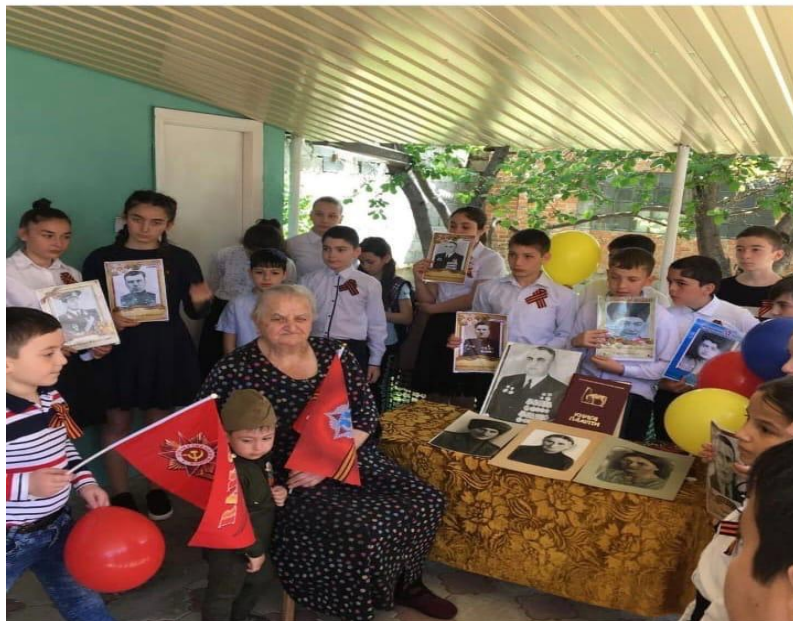
Героя Советского Союза Абаева А.М.