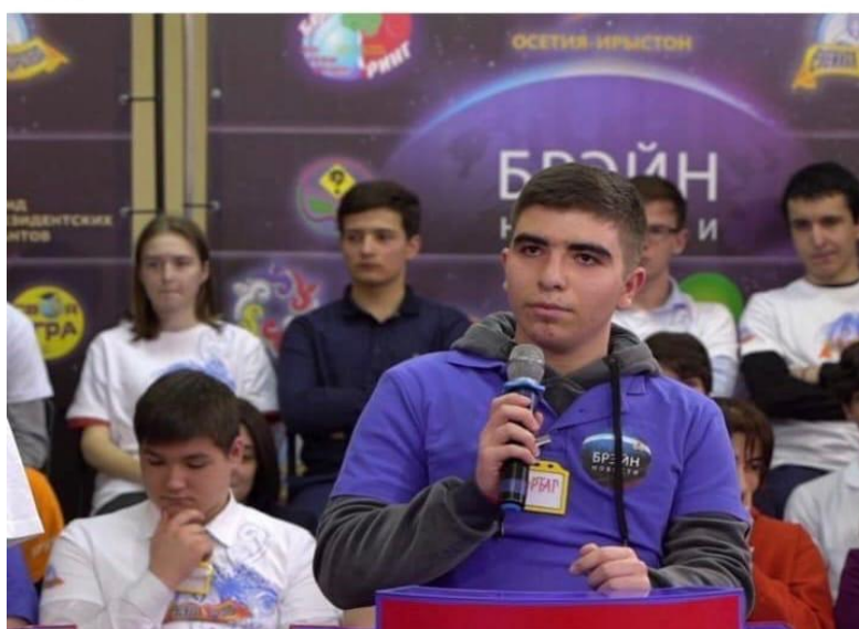
Участие в республиканском Брейн-ринге.