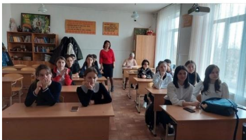
Занятия по направлению «Пед.классы»