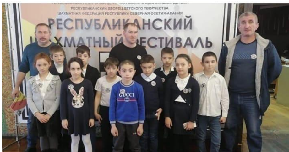
Учащиеся начальных классов приняли участие в республиканском шахматном конкурсе.