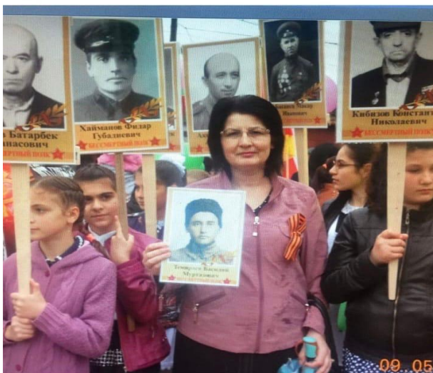
Участие в акции «Бессмертный полк»