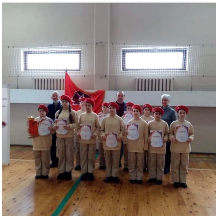
Юнармейцы младшая группа «Орлята» приняли участие в республиканском фестивале строя и песни посвященного Дню защитника Отечества.