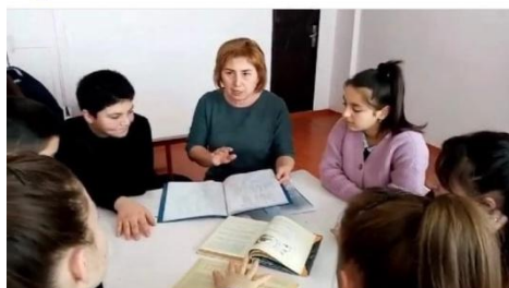
Мастер-класс по направлению «Пед.классы»