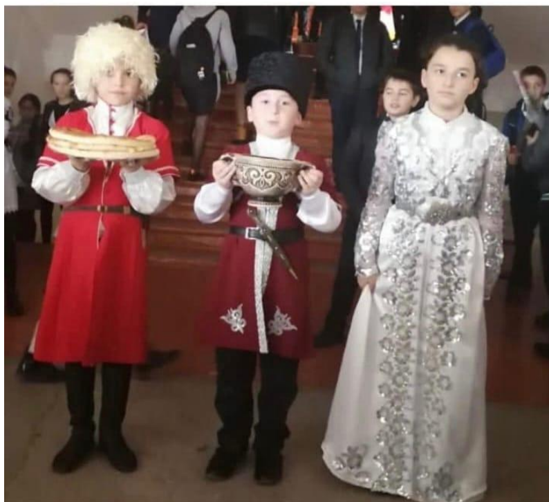
Праздник посвященный Дню Единства