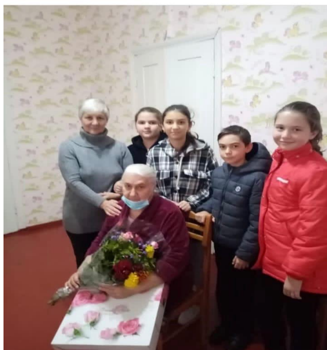
Поздравление ветеранов пед.труда на День учителя